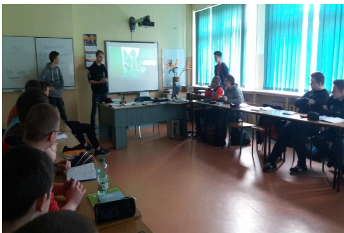
Na zdjęciu: Wykład i prezentacja dla uczniów klasy 1B Zespołu Szkół nr 4 w Szczecinie.