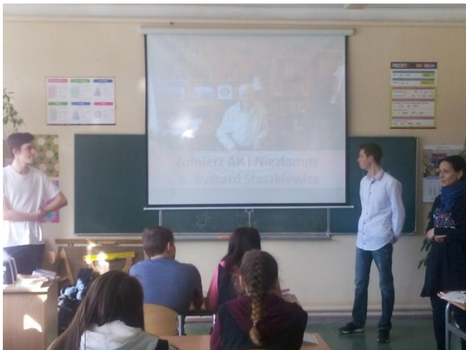
Na zdjęciu: Wykład Drużyny Gryfa dla uczniów Gimnazjum nr 27 w Szczecinie.

Poniżej przedstawiamy zdjęcia upamiętniające te wydarzenia: